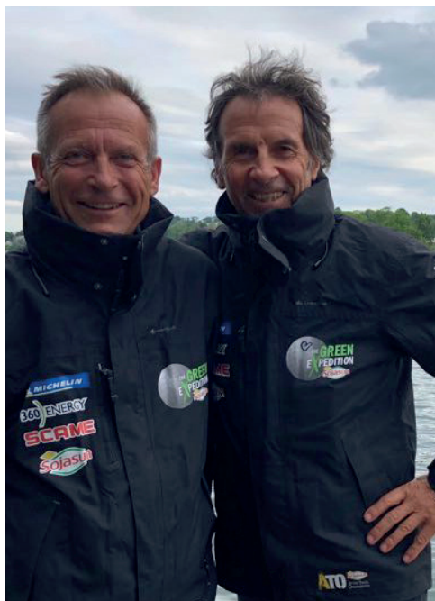
Eric Loizeau et Laurent Bignolas engagés ensemble pour la protection de la planète

Éric Loizeau, né le 3 octobre 1949, est un navigateur et alpiniste français surnommé «Le Captain». Il est connu pour avoir été un des grands skippers des années 1980. Ayant changé de vie pour devenir alpiniste dans les années 1990, il a gravi le mont Everest en mai 2003. Il est l'organisateur du Trophée Mer Montagne.